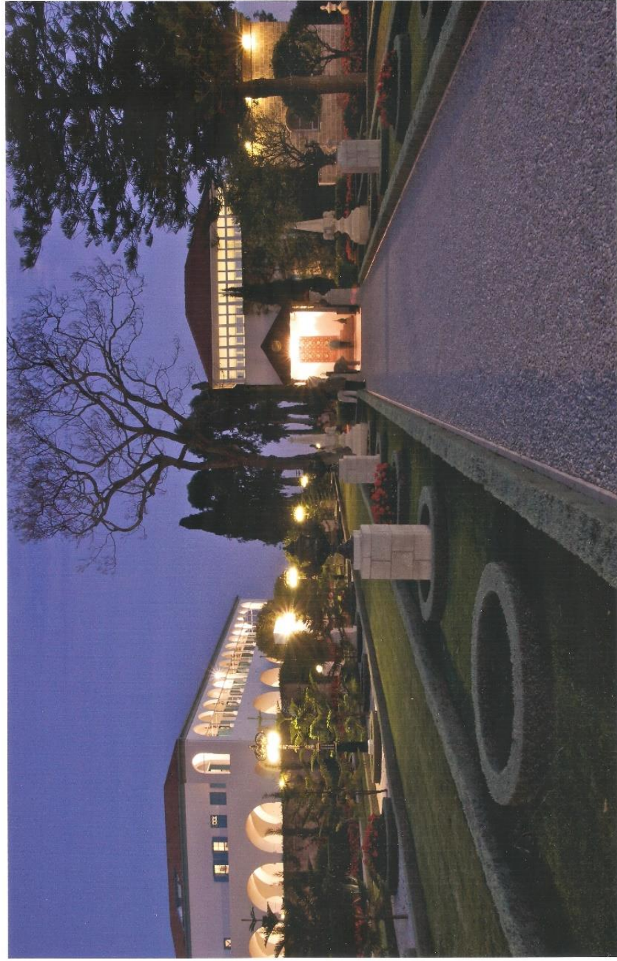
La Qibleh des Bahá'ís. A gauche le manoir où Bahá'u'lláh a habité les dernières années de sa vie.