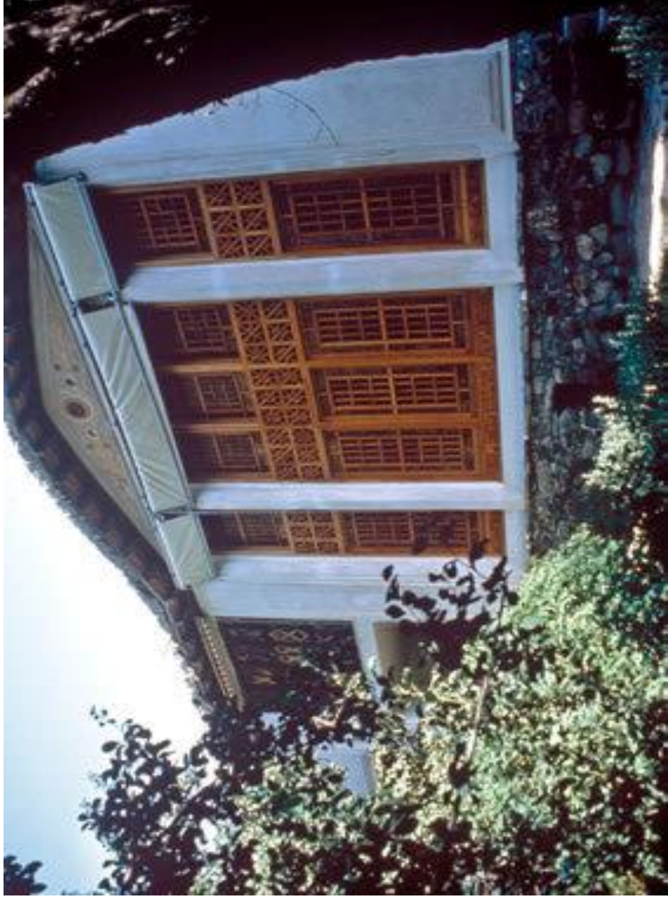
La demeure de Bahá'u'lláh durant son enfance et sa jeunesse. Détruite par le Gouvernement Iranien en 1981